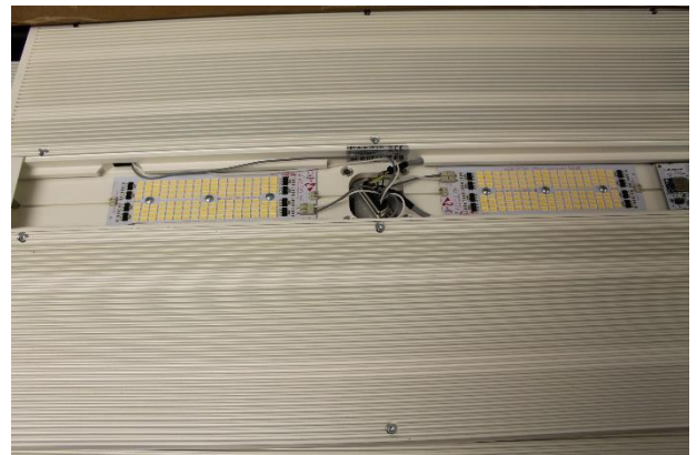
Bild 2 Ansicht auf die LED-Module - indirekter Halbraum